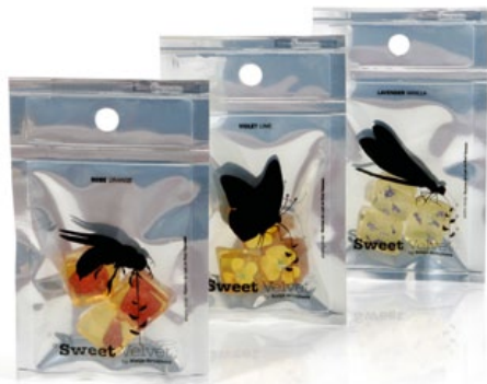
Sweet Velvet, proj. Katja Grujters