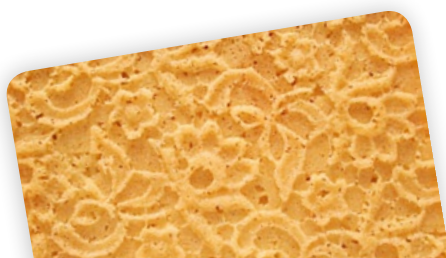
Herbatnik Ander Kant, proj. Katja Gruijters