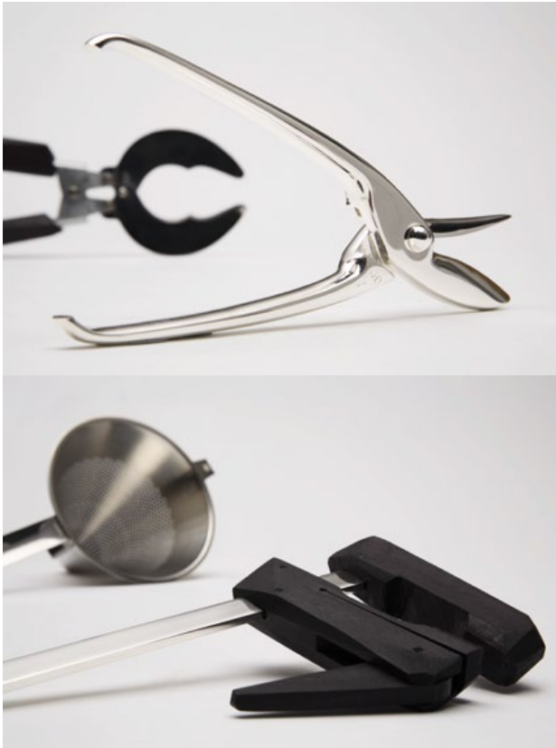
Zestaw przyborów kuchennych Boffi: On One Field to Another, 2008, proj. Marc Brétilot