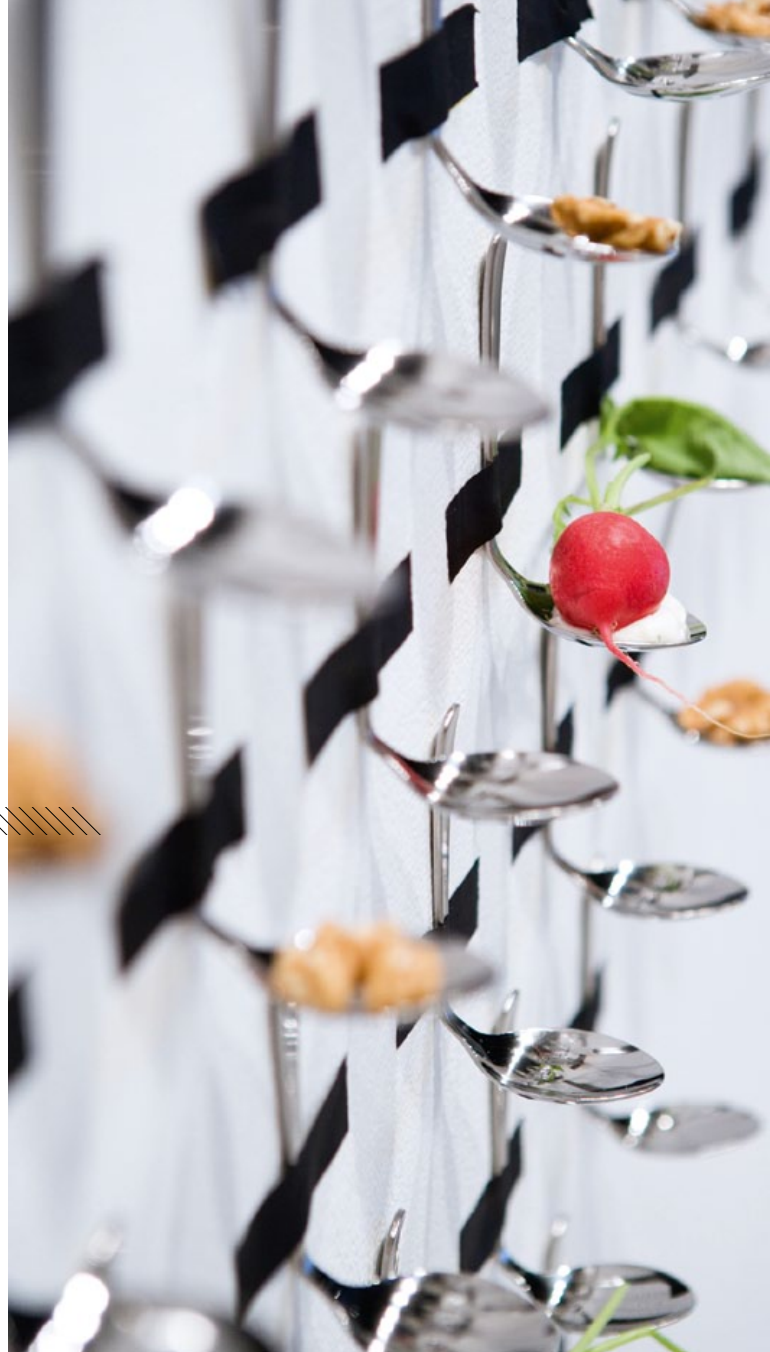
Spoon, proj. Marije Vogelzang

Żywność jest produktem masowym. Jak każdy produkt musi więc zostać zaprojektowana. Człowiek rozróżnia tylko cztery podstawowe smaki, więc dla jakości doznania istotne są jeszcze zapach, konsystencja, a także forma czy nawet dźwięk wydawany podczas jedzenia – tu znów pojawia się wyzwanie projektowe. Ponadto jedzenie jako produkt powinno być funkcjonalne (łatwość przygotowania, trwałość, możliwość transportu), musi spełniać wymogi produkcyjne, a także ma być atrakcyjne dla konsumenta. Pomyślmy chociażby o makaronie – tagliatelle, penne, spaghetti, bucatini, fusilli... Długo można by wymieniać jego różne odmiany, które różni przede wszystkim forma, a nie smak. W zależności od kształtu makaronu różnie układają się na nim sos oraz dodatki, inaczej też komponuje się on na talerzu.