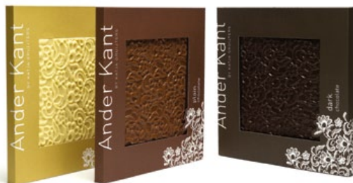
Czekolada Ander Kant, proj. Katja Grijters

////// Codziennie na całym świecie ludzie kupują produkty spożywcze, które później zgodnie ze swoją kulturą, religią czy smakiem przyrządzają, a następnie spożywają. Jedzenie to doskonałe źródło inspiracji do twórczych działań. Jaką postać może więc przybierać projektowanie połączone z pożywieniem? > GOSIA LPIŃSKA