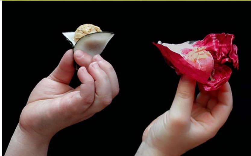
LeCaire-Athènes, proj. Marc Brétilot